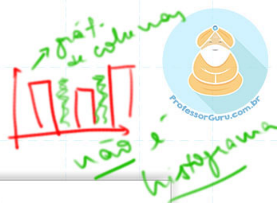
Estatura dos alunos da Escola A.B.C.

Atente para que, no caso do histograma, as colunas fiquem sempre juntas , caso contrário, você estará construindo um gráfico de COLUNAS e NÃO um HISTOGRAMA.